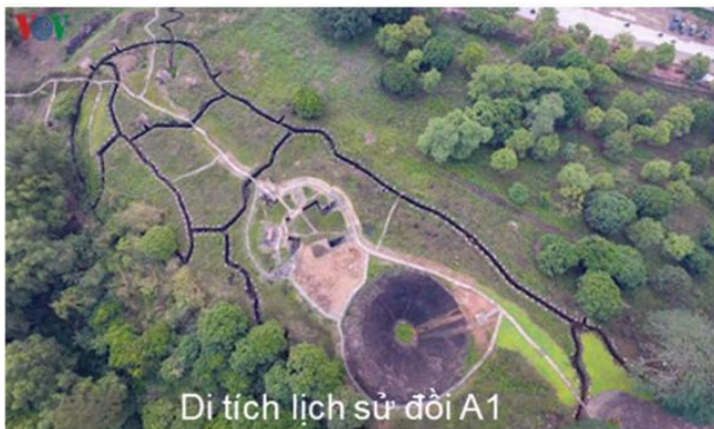
Di tích lịch sử đồi A1

Di tích lịch sử Chiến trường Điện Biên Phủ, nằm trên địa bàn các huyện: Tuần Giáo, Điện Biên và thành phố Điện Biên Phủ; là một trong mười di tích cấp Quốc gia đặc biệt được xếp hạng đầu tiên trong cả nước năm 2009 với 22 điểm di tích thành phần. Năm 2015, Thủ tướng Chính phủ đã phê duyệt bổ sung 23 điểm di tích thành phần khác nâng tổng số điểm di tích được công nhận lên 45 điểm di tích, cụ thể như sau: