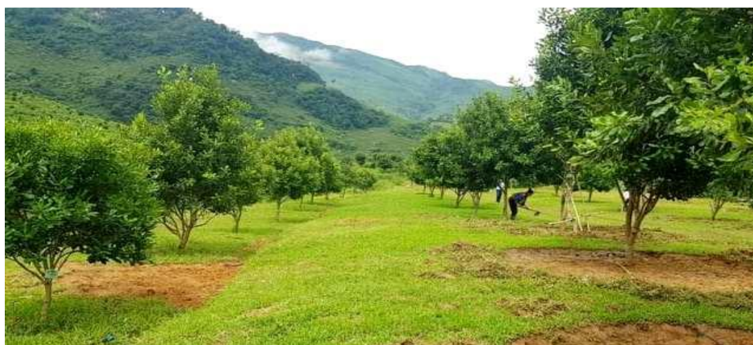
Cây Mắc ca tại huyện Tuần Giáo

Về điều kiện tự nhiên của tỉnh: điều kiện khí hậu ở một số địa bàn phù hợp với cây mắc ca, tuy nhiên diện tích có độ dốc từ 15 - 250 chỉ chiếm 25%. Đất có độ dốc