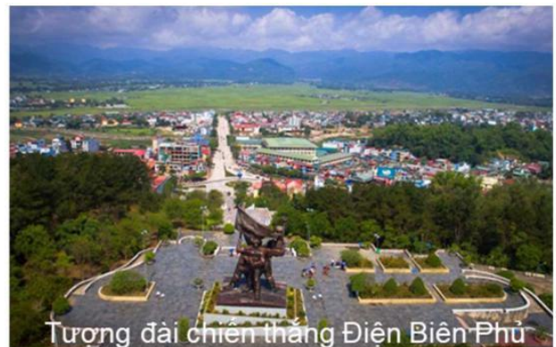
Tượng đài chiến thắng Điện Biên Phủ