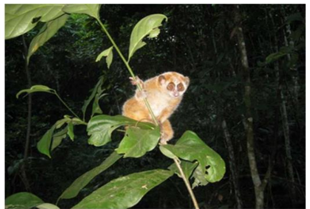
Một số hình ảnh về KBT tự nhiên Mường Nhé