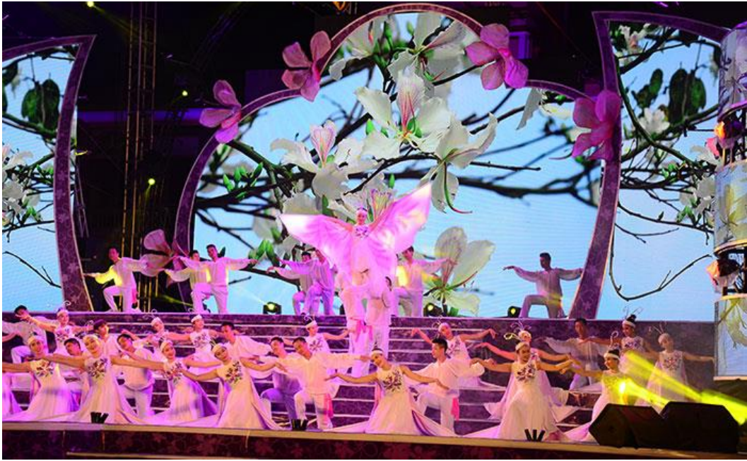
Lễ hội Hoa Ban Điện Biên

Ngoài ra, trên địa bàn tỉnh còn có một số lễ hội như hội xòe hoa, hội cơm mới của người Thái gắn liền với các bản văn hoá dân tộc có ý nghĩa đối với các hoạt động tìm hiểu, nghiên cứu bản sắc văn hóa các dân tộc miền núi Tây Bắc Việt Nam. Đặc biệt, nghệ thuật Xòe Thái - được UNESCO công nhận là di sản văn hóa phi vật thể và Di sản “Thực hành Then của người Tày, Nùng, Thái ở Việt Nam” - đang được đề trình UNESCO công nhận là di sản văn hóa phi vật thể.