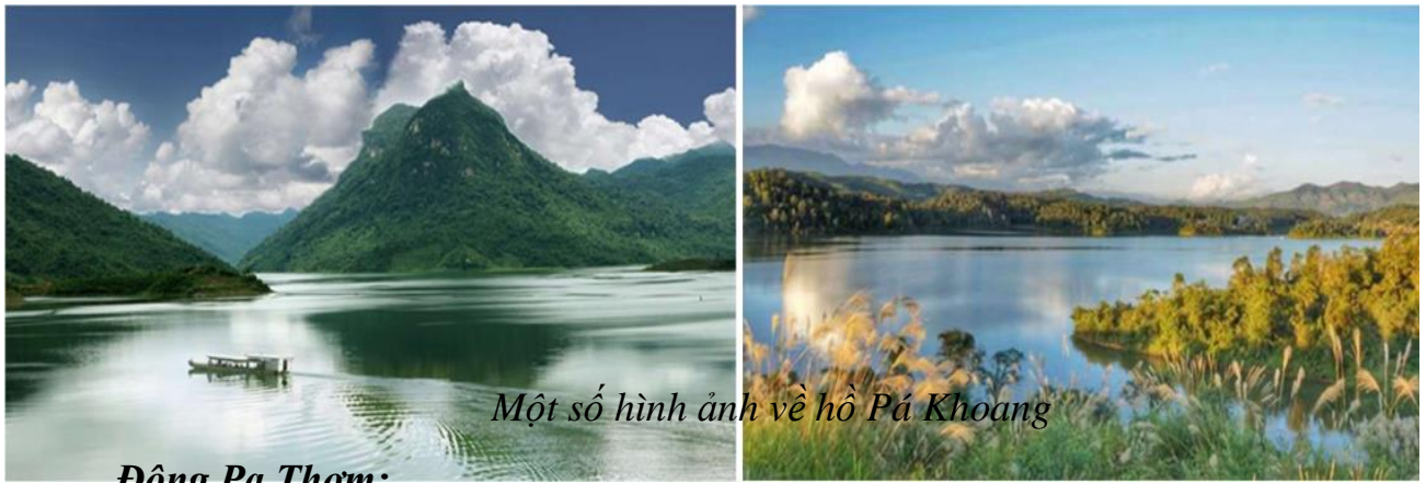
Một số hình ảnh về hồ Pá Khoang