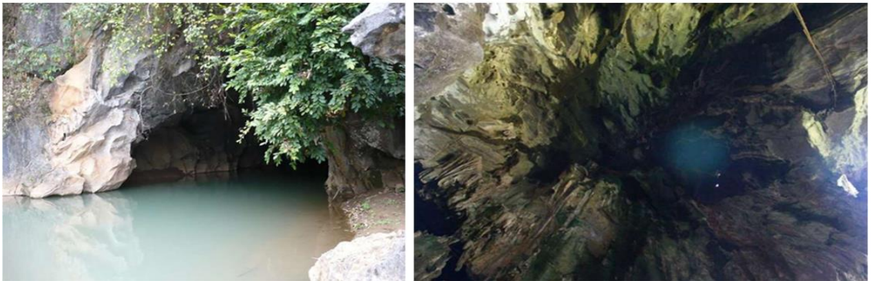
Một số hình ảnh về hang Thảm Váng

Hang Thảm Váng không chỉ là một hang đá đẹp mà còn là di chỉ khảo cổ. Tại đây nhân dân địa phương đã phát hiện một số loại rìu, chày nghiền thức ăn bằng đá, một số mẫu xương động vật hoá thạch có giá trị nghiên cứu.