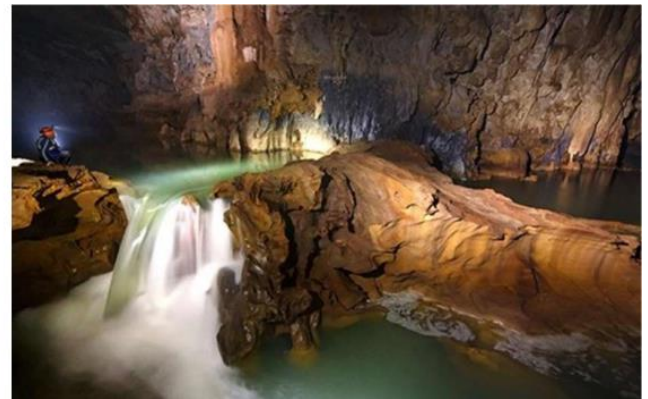
Một số hình ảnh về động Pa Thom