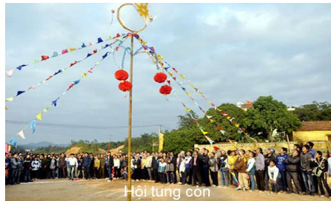
Hình ảnh Lễ hội thành Bản Phủ và Hội tung còn

Lễ hội Hoa Ban là sự kiện văn hóa tiêu biểu, được tỉnh Điện Biên tổ chức tại thành phố Điện Biên Phủ vào thời điểm trung tuần tháng 3 hằng năm nhằm giới thiệu, bảo tồn, phát huy các loại hình di sản văn hóa dân tộc của tỉnh Điện Biên, gắn bảo tồn văn hóa với phát huy tiềm năng thế mạnh du lịch, phát triển kinh tế - xã hội của tỉnh trong thời kỳ đổi mới, hội nhập và phát triển. Đồng thời, với hình tượng xuyên suốt là hoa Ban, Lễ hội còn là dịp để tôn vinh hoa Ban với vị thế là biểu trưng cho mảnh đất và con người Điện Biên nói riêng, vùng Tây Bắc nói chung.